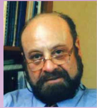
פרופ' רפי קרסו מנהל אקדמי